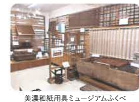
美濃和紙用具ミュージアムふくべ

中濃 10/29 (日) 10:30~14:00 会場/美濃和紙用具ミュージアム ふくべ (美濃市片町813)