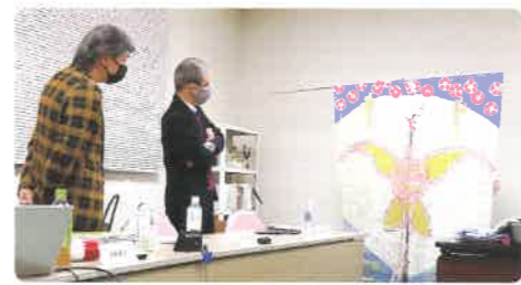
写真は昨年の講座の様子です

創作活動を行う方だけでなく、鑑賞者、ギャラリスト、コレクターなど美術に興味がある方、誰をも対象としたプログラムとしてスタートしました。今年も今まで通り幅広くアートに関する疑問、質問にお答えしていきたいと思えます。同時に参加者の多くは制作者が占めます。相談会とあわせて作品へのアドバイスもおこなうため、制作者はできるだけ実作(大作可)を持参頂き(持参不可能な場合は画像も可)それを言わば公開講評のようなかたちでアドバイスしていきます。