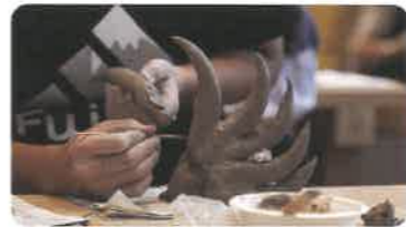
写真は昨年の講座の様子です

動物等(人・魚・鶏・その他なんでも可)を制作焼成。講師による作品制作へのアドバイス等も受けながら楽しく彫刻を学びます。2回目は完成した作品を鑑賞しながら講座「美の世界」を行います。