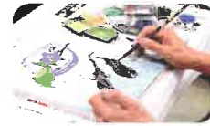
写真は昨年の講座の様子です

新聞紙、ラップフィルム、ローラーによる絵具表現の中から好きなものを選んで背景を作ります。その上に鳥を配するのにも花を咲かせるのにも皆さんのお好み次第。描いて楽しく飾ってステキ、現代日本画講座です！